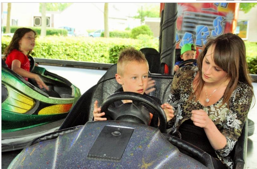
◀ Plezier in de autoscooter/botsauto's.