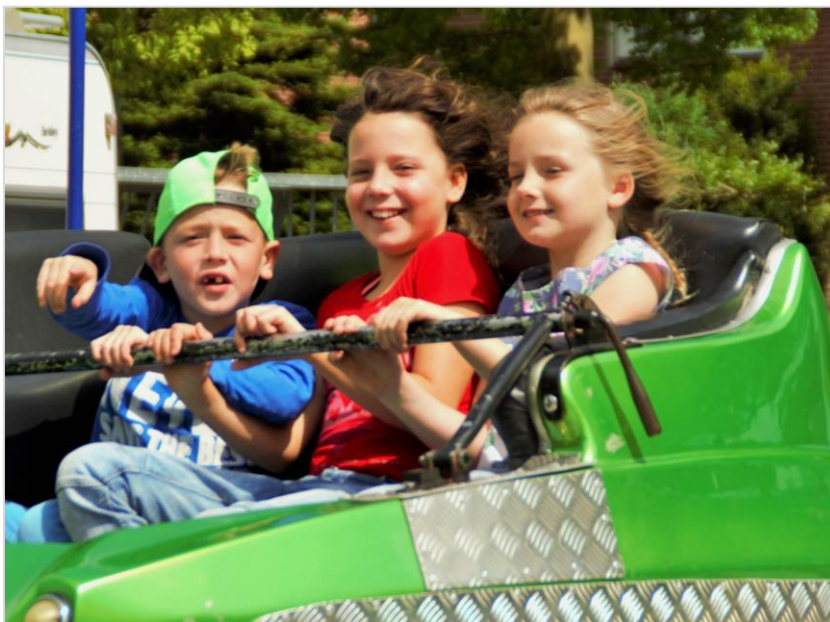
▲ Ripse kinderen maken plezier tijdens een ritje in de Calypso.

De laatste jaren werd de populariteit van de kermis een stuk minder. Ook de kermisattracties kregen het moeilijker door minder bezoekers. Om in De Rips de kermis toch aantrekkelijk te houden werd er een commissie gevormd, die allerlei activiteiten rondom de kermis organiseerde. Zodat het een leuke festiviteit blijft en een belangrijk plek waar men oude bekenden kan tegenkomen.