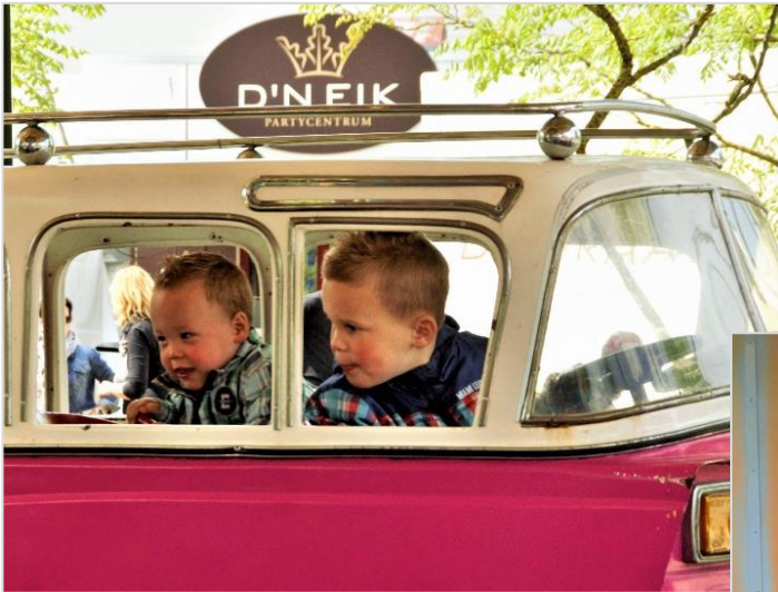
◀▼ Volop spanning en plezier in de draaimolen/mallemlen.