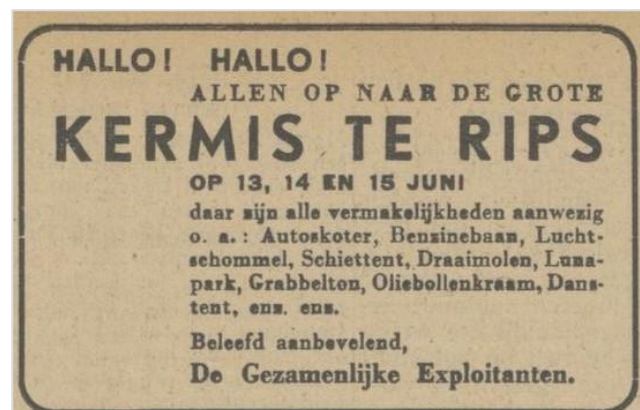
► Advertentie in De Zuid Willemsvaart 12 juni 1948.

◀ Truus Beckers op het kruispunt in De Rips. Op de achtergrond de weg richting Elsendorp. Aan de linkerkant is goed te zien dat in de oorlog de Canadian Forestiers alle bomen daar gekapt hebben. De stammen werden gebruikt om natte of rotte gaten in zandwegen op te vullen.