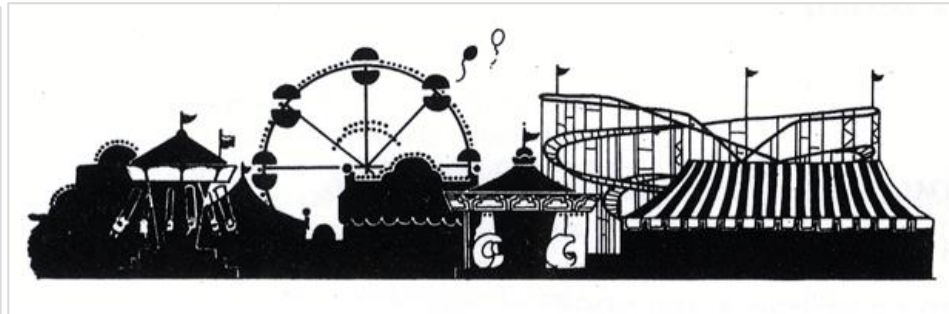
▲ Kermisaffiche uit 2004.